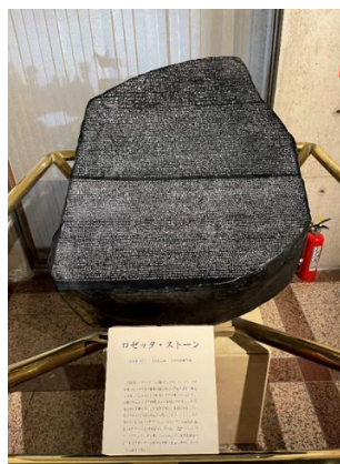
ロゼッタ・ストーンのコピー

※本編の日帰り研修旅行は昨年4月27日(土)に開催されたものです。次号は昨年10月27日(日)に行われた日帰り研修旅行について掲載いたします。